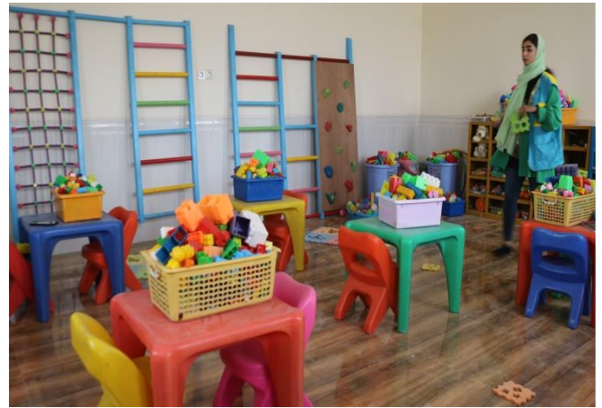
ساخت خانه کودک نوحانی بازار