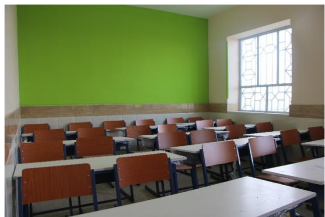
بازسازی دبیرستان دخترانه کهن