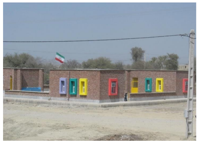
ساخت مدرسه در روستای بل بالا