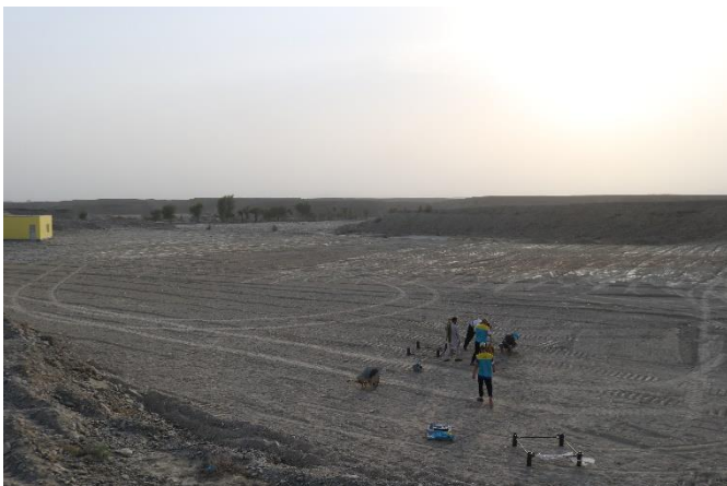
راه اندازی و تجهیز دارالفنون