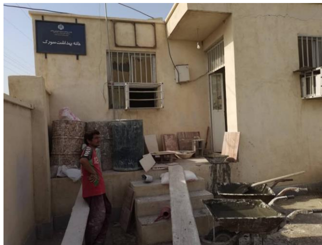
بازسازی خانه بهداشت سورک در لیردف