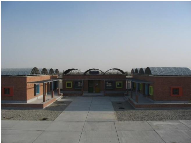
ساخت مدرسه کارو دانش پسرانه روستای دنسر