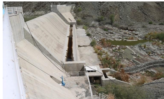
آب رسانی به روستای شیخ کنگ