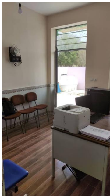
بازسازی خانه بهداشت ماندیرو