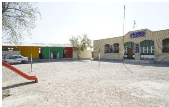
بازسازی مدرسه روستای خندق