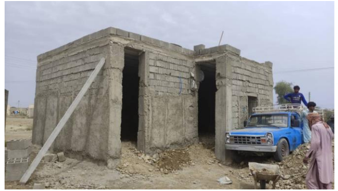
بازسازی خانه فرد نیازمند در تلنگ