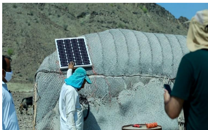
برق رسانی با سلول خورشیدی به روستای چراغ آباد