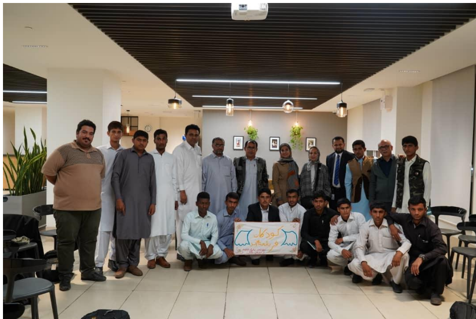
اردوی آموزشی پژوهشی پسران آفتاب به تهران