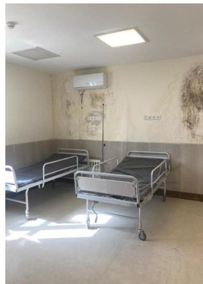
تجهیز درمانگاه لیردف