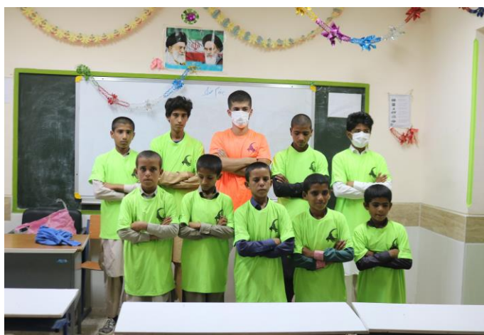
مشارکت در ارتقا امور آموزش، عمرانی، مهارتی، خلاقیتی و ورزشی کودکان منطقه