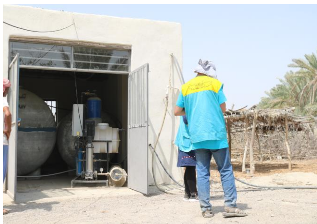
نصب و راه اندازی ۶ آب شیرین کن در روستاهای تلنگ